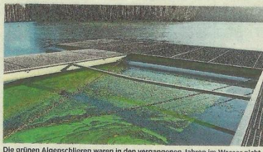
Die grünen Algenschlieren waren in den vergangenen Jahren im Wasser nicht zu übersehen.

Ob es in der Badesaison 2021 zu Algenproblemen kommen wird, lässt sich laut Krause nicht vorhersehen. Über die Wasserqualität des Badesees informiert kurz vor der Saison wieder die Region Hannover. Dass es 2020 keine Probleme mit Algen gegeben habe, stimme optimistisch. „Ein kühleres Jahr wäre für den See dennoch nicht schlecht“, sagt Krause. Das Gutachten endet mit dem Hinweis: „Nährstoffemittre durch Erholungssuchende und Badegäste weitestgehend zu vermeiden“.