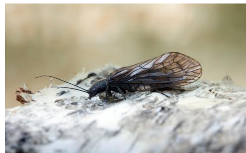
ABBILDUNG 3: ADULTES TIER VON SIALIS LUTARIA