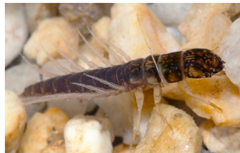
ABBILDUNG 2: SIALIS LUTARIA , AUFFÄLLIGE KIEMENBLÄTTCHEN UND MUNDWERKZEUGE

Packard, A. S. (Alpheus Spring), 1839-1905 - A text-book of entomology, including the anatomy, physiology, embryology and metamorphoses of insects