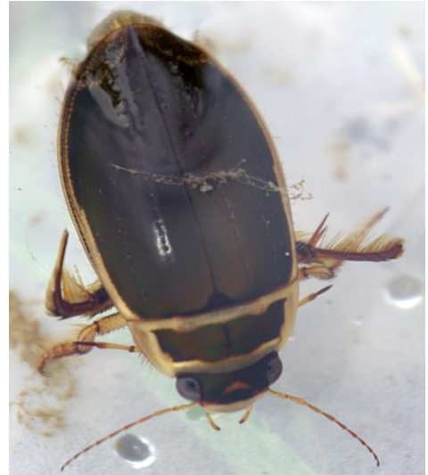
ABBILDUNG 1: HALSSCHILD UND FLÜGEL SIND GELB GERANDET

Der Käfer kann eine Luftblase mit unter Wasser nehmen und muss dann erst nach ca. 10-15 Minuten wieder auftauchen. Er kommt dennoch nur in sauberem Wasser vor.