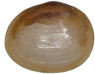
ABBILDUNG 1: LINKE KLAPPE VON PISIDIUM PSEUDOPHAERIUM

Lebt auf schlammigem Boden und auf Wasserpflanzen, benötigt ausreichend Sauerstoff.