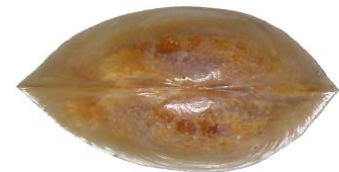
ABBILDUNG 2: PISIDIUM PSEUDOPHAERIUM Beide Bilder: Michal Horsák - Horsák M., Juříčková L., Beran L., Čejka T. & Dvořák L. (2010). https://commons.wikimedia.org/w/index.php?curid=12080393