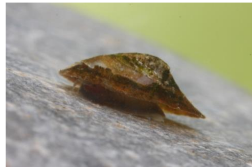
ABBILDUNG 1: NAPFSCHNECKE https://upload.wikimedia.org/wikipedia/commons/b/b9/Acroloxus_lacustris_A_MRKVICKA.JPG

Diese Schnecke nimmt Sauerstoff aus dem Wasser über die Haut auf. Sie nimmt keinen atmosphärischen Sauerstoff an der Wasseroberfläche auf.