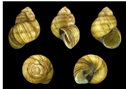
ABBILDUNG 1: VIVIPARUS VIVIPARUS

Atmen mit einer Kieme und können bei Trockenheit das Gehäuse mit einem Deckel verschließen Sie kommen hauptsächlich in Flüssen und im Randbereich von Seen vor, wo Wellen an das Ufer schlagen.